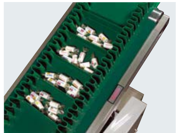
サイドウォール使用例

ベルト表面の両側の長さ方向に波型の棧を取り付けます。傾斜搬送、粉体搬送などの、荷こぼれ防止に使用されます。